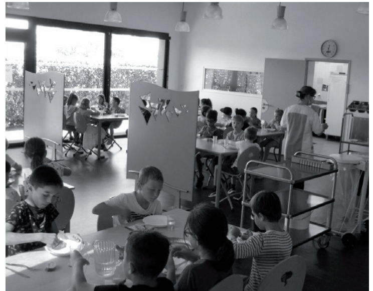
◀ Salle des petits