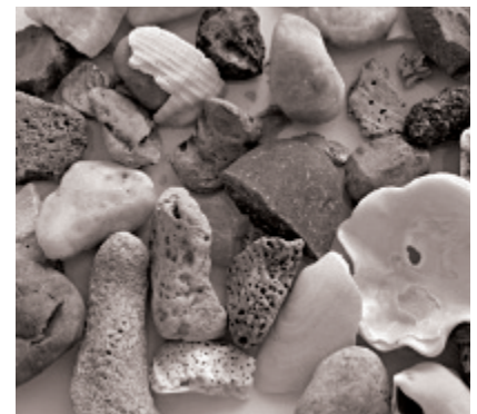
▲ Echantillons des cailloutis : silex noirs, galets de quartz, éponges, débris coquilliers