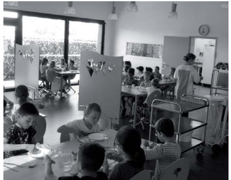
◀ Salle des petits