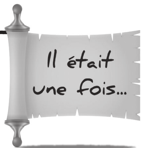
La colonne de la Boutarlière