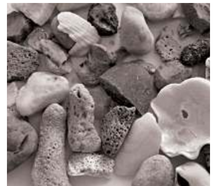
▲ Echantillons des cailloutis : silex noirs, galets de quartz, éponges, débris coquilliers