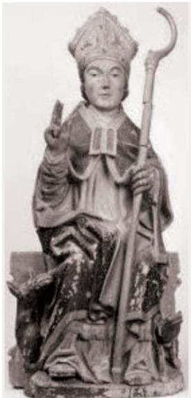
▲ St Médard

Quand à la Reorthie, aussi nommée retorta dans certains manuscrits, il s'agit d'un anneau de bois qui sert à lier les fagots (on trouve ce mot sous différents aspects dans de nombreux endroits boisés: Rothelière, Réorthière et autres Rorthie). C'est bien avec les nombreux bois de châtaigniers, qu'on trouve en abondance autour de nous et dont on peu facilement « retordre » les branches que l'on fabrique de solides liens de fagots.